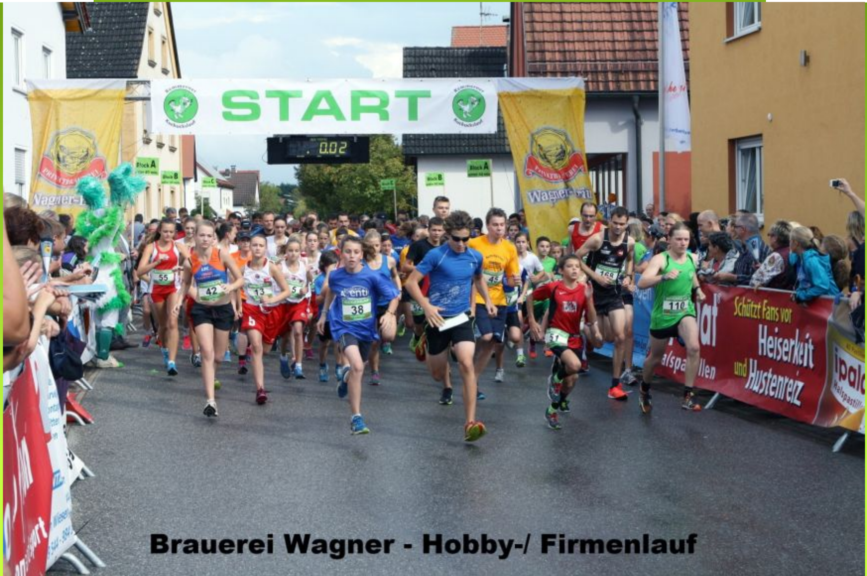
Brauerei Wagner - Hobby-/ Firmenlauf